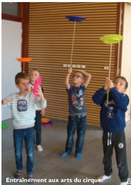
Entraînement aux arts du cirque.

Une nouvelle rentrée a eu lieu à La Vallée verte. Malgré une baisse des effectifs observée en ce début d'année, l'école reste à 8 classes. Suite aux discussions et décisions prises début janvier 2018, la Vallée Verte est repassée à 4 jours avec les horaires suivants: 8h30-12 heures et 14 heures-16h30.