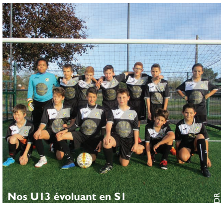
Nos U13 évoluant en S1